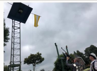
Het kringkoningschieten op een houten vogel.