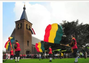
Het vendel wordt gezwaaid voor 'God, Koning & Vaderland'.

In 2022 viert de schutterskring "Rijk van Nijmegen - de Betuwe" feest. De kring "Rijk van Nijmegen" en de kring "De Betuwe" zijn ieder afzonderlijk van elkaar opgericht in 1947. In 1972 zijn beide kringen samengevoegd. De gilden en schutterijen hanteren het devies "Broederschap, Trouw, Dienstbaarheid". Zij beoefenen eeuwenoude tradities.