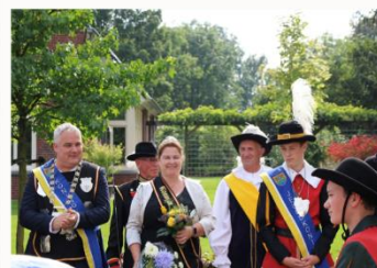
Huldiging van de nieuwe kringkoning & jeugd kringkoning.