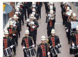
Muziekkorpsen marcheren door de straten.